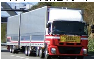
実験で走行中のダブル連結トラック

現状はモーダルシフトの推進の方が効率的です。でも、こんなトラック運転出来たらカッコいいですね！